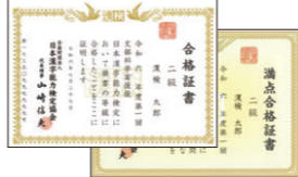
※満点の場合、特別な合格証書が送られます。